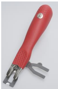
Zum Abstoßen der Schweißschnur empfehlen wir das Mozart Abstoßmesser