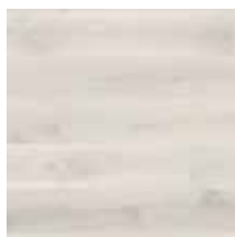
Eiche Opal White