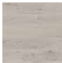
Eiche Urban Grey