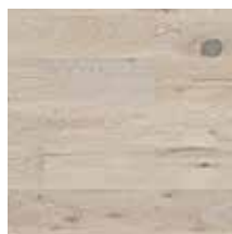
Eiche Lime Stone