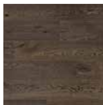
Eiche Old Brown