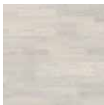
Eiche Chalk White